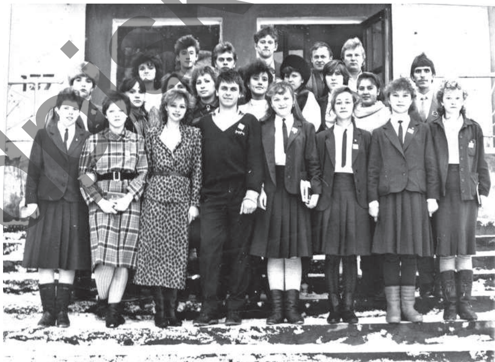
● Делегация комсомольцев посёлка Нижегородец на мероприятии у здания районного Дома культуры (1989 год)

О комсомоле можно вспоминать много и рассказывать долго. Для многих он стал самой счастливой порой жизни. Ведь комсомол – это не только